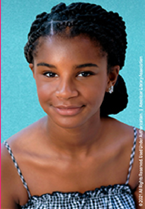
1. American Library Association